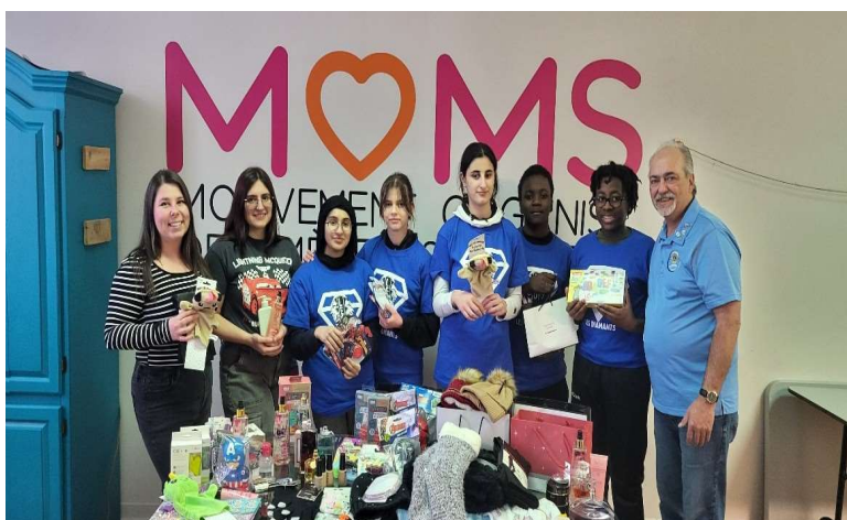
Gracieuseté des Cinq jeunes du Club LÉO Les Diamants ont remis des produits essentiels à l'organisme MOM'S de Terrebonne

Ils demandaient alors aux propriétaires de pharmacies s'ils pouvaient leur remettre gracieusement afin qu'ils puissent en faire don à l'organisme MOM'S qui vient en aide aux jeunes mères monoparentales.