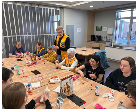
Bricolage de Pâques