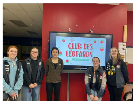
Les membres Léopards