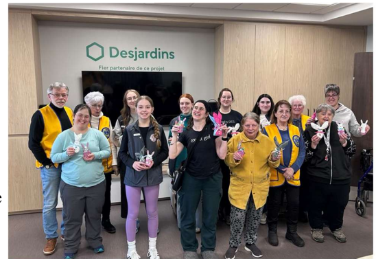
Des participants heureux

Mercredi le 9 avril, les membres Leo sont retournés aux appartements « Libère Toit » pour réaliser cette fois-ci un bricolage de Pâques. Chaque LEO s'est jumelé, d'une manière tout à fait naturelle, avec une personne qui vit avec une différence. De beaux échanges ont eu lieu. Ils ont partagé une collation et ont bricolé dans la joie comme le démontre les diverses photos.